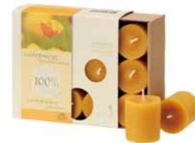
100% 純粋蜜ろう パーティーキャンドル 9ヶ入 [MC95103116] 2,700円 φ 3.7×4.2cm 9個入り 8h