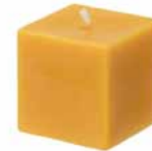
100% 純粋蜜ろうビッグキューブキャンドル [MC95102102] 2,600円 7×7×7cm 14h