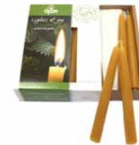
100% 純粋蜜ろうクリスマスツリーキャンドル ナチュラル 20本入 [MC95102513] 2,900円 φ 1.3×11cm 2.5h