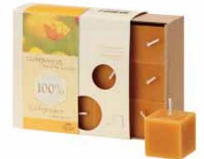
100% 純粋蜜ろうスモールキューブキャンドル9ヶ入 [MC95102101] 3,700円 3.7×3.7×3.7cm 7h