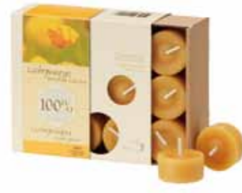
100% 純粋蜜ろう ティーライトキャンドル18ヶ入 [MC95102720] 3,000円 φ 3.7×2cm 4h