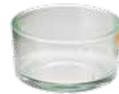
ティーライトキャンドル用 ガラスホルダー [MC95103114] 140円 φ 4.4×2.3cm ガラス製