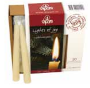
100% 純粋蜜ろうクリスマスツリーキャンドル アイボリー 20本入 [MC95102514] 2,900円 φ 1.3×11cm 2.5h