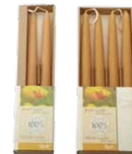
100% 純粋蜜ろうキャンドル ナチュラル [MC95102127] 1,550円 φ 2.2×25 2本入り 12h [MC95102129] 2,700円 φ 2.2×25 4本入り 12h