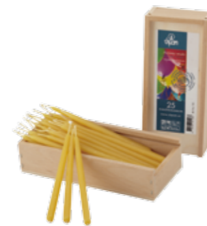
100% 純粋蜜ろう パースデーキャンドル 25本入 [MC95102106] 2,200円 φ 0.6×11cm 0.75h