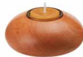
ティーライトキャンドル用 木製ホルダー [MC95103124] 2,100円 φ 10×H3cm 蜜ろうキャンドル 1個付きです。