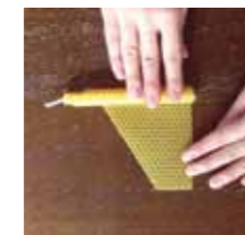
③ころがしながらシートをくるくる軽く巻きます