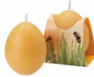
100% 純粋蜜ろうエッグキャンドル [MC95102901] 650円 φ 4×5cm 4h

ディパンは 1983 年から世界各地から厳選された 100% 純粋蜜ろうをいくつか組み合わせ、一定の明るい色調と自然な香りのキャンドルを製造しています。色や香りを統一するための着色料や香料は一切使っていません。ヨーロッパ薬局方基準に準じ、薬品に使用できる品質です。