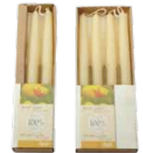
100% 純粋蜜ろうキャンドル アイボリー [MC95102128] 1,700円 φ 2.2×25 2本入り 12h [MC95102124] 3,000円 φ 2.2×25 4本入り 12h