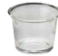
パーティーキャンドル用 ガラスホルダー [MC95102103] 250円 φ 4.4×3.5cm