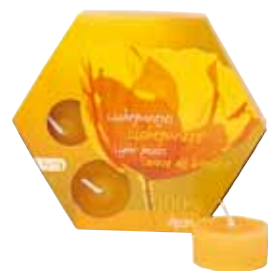
100% 純粋蜜ろう ティーライトキャンドル7ヶ入 [MC95102707] 1,300円 φ 3.7×2cm 4h アルミケース入り

蜜ろうはミツバチが巣を作るときに分泌するろうです。 光の中をミツバチは花を求めて飛び交い、蜜や花粉を巣に持ち帰ります。蜂蜜の一部は六角形をした巣作りに使われます。 蜂蜜はミツバチの体内で変化し、ろうとなって分泌され、そのろうを加工し、巣を形成していきます。 蜜ろうキャンドルは低い温度で溶け出して完全燃焼するので部屋を汚すススや油煙はほとんど出ません。